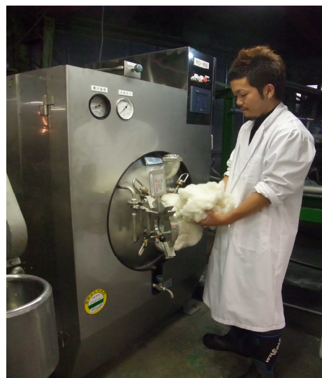
繭の加水分解作業