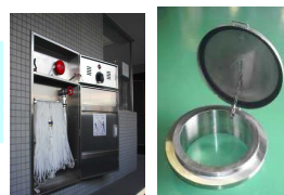
消火栓 丸型ハッチ

「顧客目的」と「コスト・機能・品質のつくりかた」を一致させるため、メーカーとしての 実績・経験・人 を結集して、ものづくりに取り組みます。