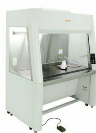
クリーンブース筐体