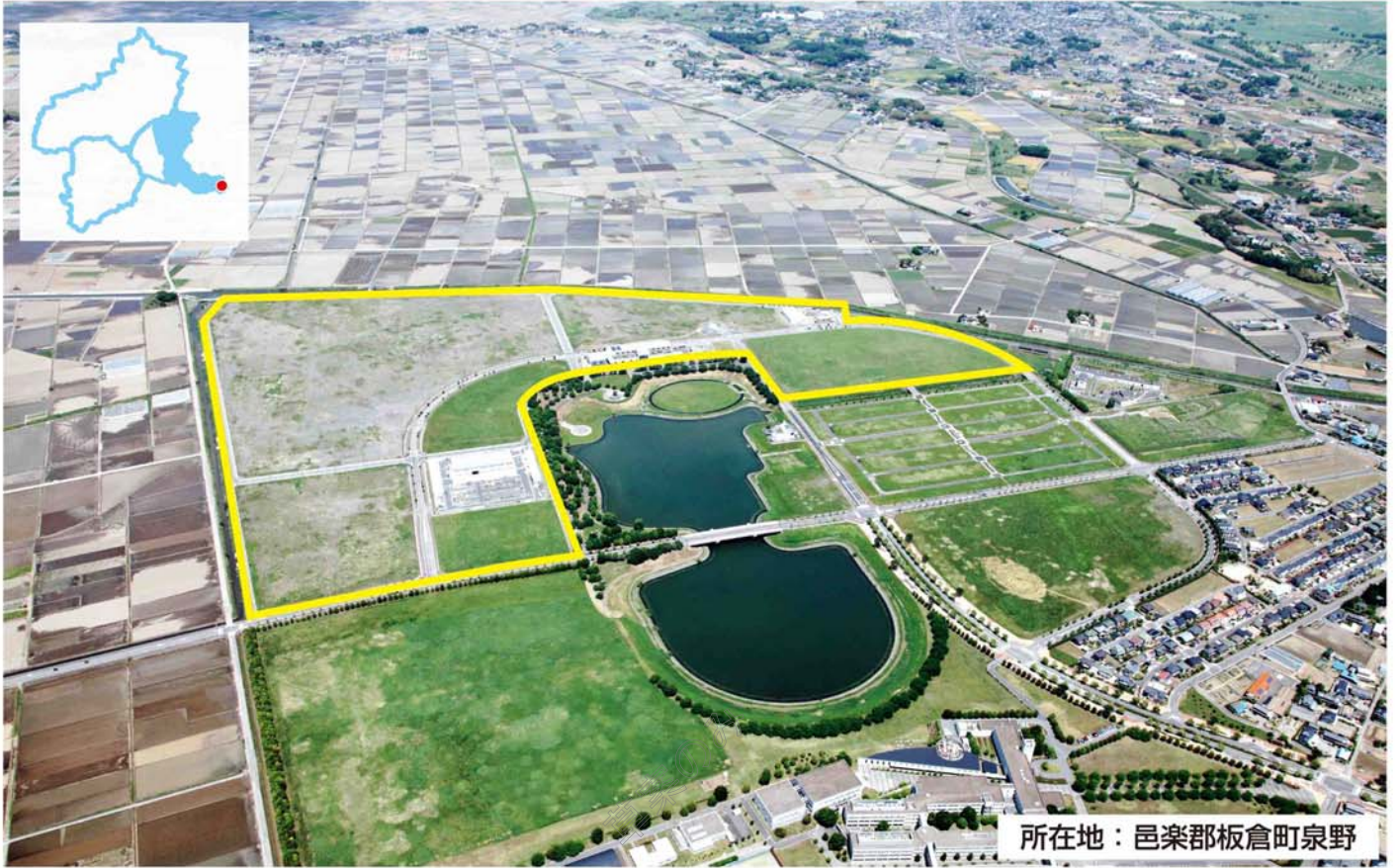
所在地： 邑楽郡板倉町泉野

団地内に東洋大学生命科学部・食環境科学部及び同大学院生命科学研究科があり、食品・環境関連などでの幅広い産学連携が可能です。東北自動車道館林I.Cまで約10分、そこから東京都心まで約1時間と交通アクセスが良好です。また、工業用水の利用も可能で、インフラ面も充実しています。