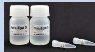
プロテインA製品見本

タンパク質の生産技術を活かして、 抗体医薬品の製造に欠かせない プロテインA の製造販売も開始