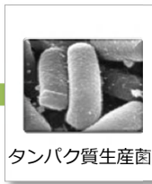
タンパク質生産菌