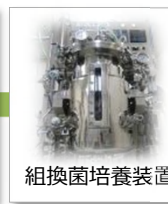
組換え菌培養装置