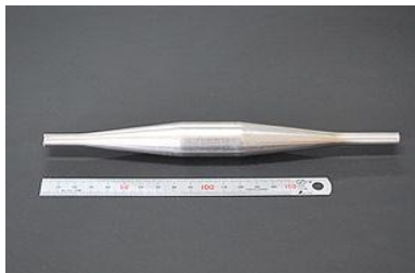
(ステンレスパイプの両端面テーパ加工事例)

材質：SUS304 肉厚：t0.8 外径：φ25.4 原管φ25.4に対し先端径でφ9.2まで絞り込みました。 テーパ角度は14度、設備能力的には20度までが限界のようです。(材質による) 小径は、原管でφ5.0まで加工出来ます。 今回は比較的太径でしたが、小径も可能ですので、ご相談下さい。