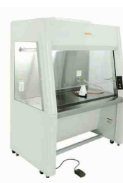
クリーンブース筐体