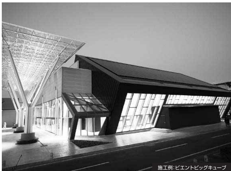
施工例:ピエントビッグキューブ