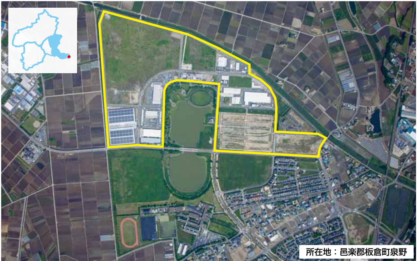
所在地： 邑楽郡板倉町泉野

団地内に東洋大学生命科学部・食環境科学部及び同大学院生命科学研究科・食環境科学研究科があり、食品・環境関連分野等の産学連携が可能です。東北自動車道館林I.Cまで約10分、そこから東京都心まで約1時間と交通アクセスが良好です。また、工業用水の利用も可能で、インフラ面も充実しています。