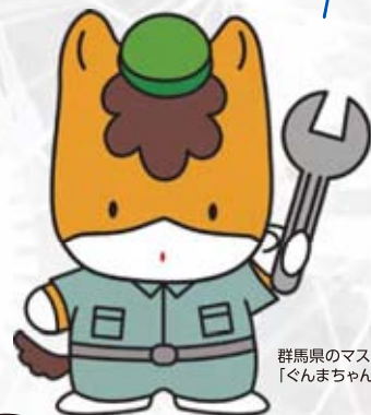
群馬県のマスコット 「ぐんまちゃん」