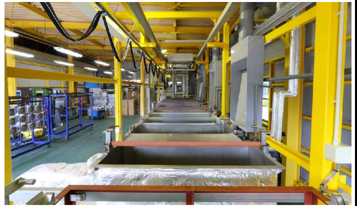
新設した全自動ライン。アルマイトの量産に対応する