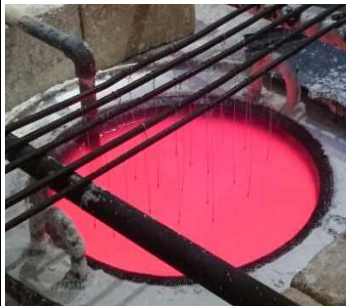
曲り・歪みの軽減化