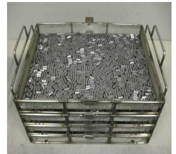
クリーン梱包が可能

【開発進度】 H29.6現在 アイデア段階 試作/実験段階 開発完了段階 製品化完了段階