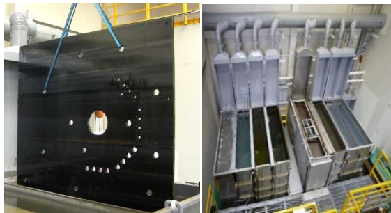
大型部品～量産部品など幅広く処理可能