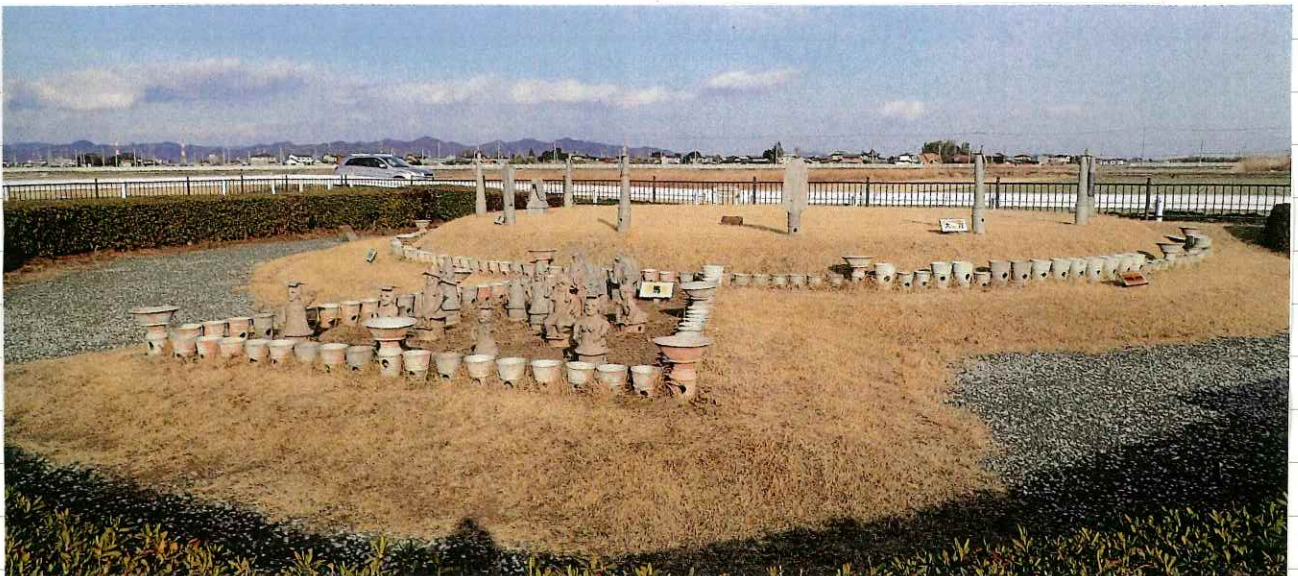
122 復元・整備された塚廻り4号墳