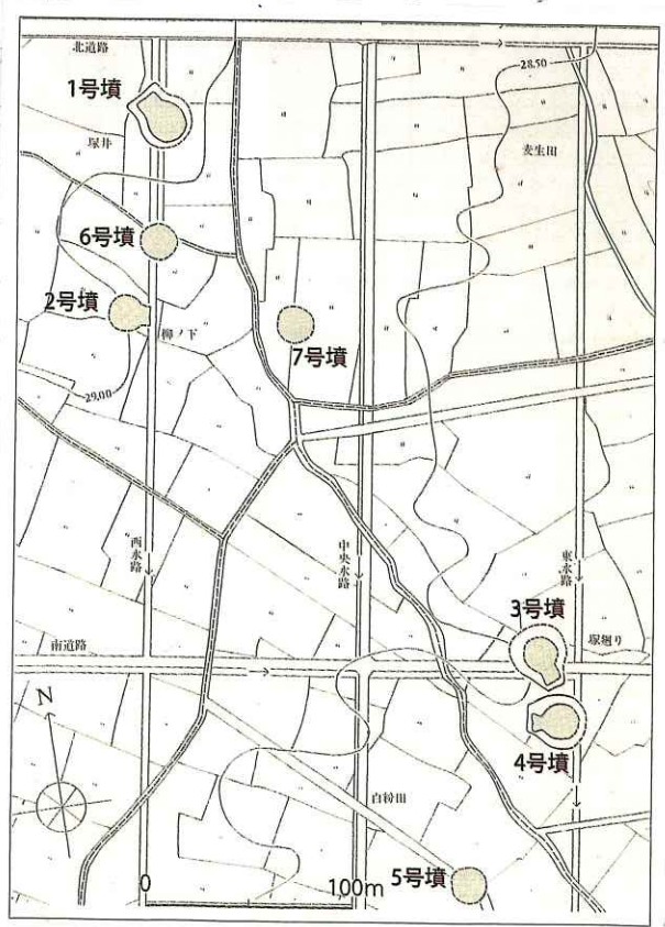
塚廻り古墳群の分布 (報告書より、一部加筆)

3.4ごうふんは、ほたてがしきこふんです。しゅうだんのリーダーが3.4ごうふんであったと考えられます。4ごうふんのながさは23.6メートルです。たてられたじきは、6せいぎ前半と考えられます。しゅう体ごは、たてあなしきけいです。