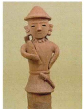
図15 笠をかぶり鍬を かつぐ農夫