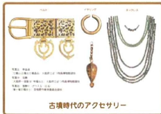
図16 古墳時代のアクセサリ

当時めずらしかった金のアクセサリをもつことは、その人の力を見せつけるのに役に立っていたのではないかと考えられた。アクセサリの見た目は現在のものとあまり違いはなかった。ベルトは金色でつけているだけで力強い見た目になりそうだなと感じた。ネックレスは重ねつけていたようでアクセサリをしているだけで存在感がありそうだなと考えた。