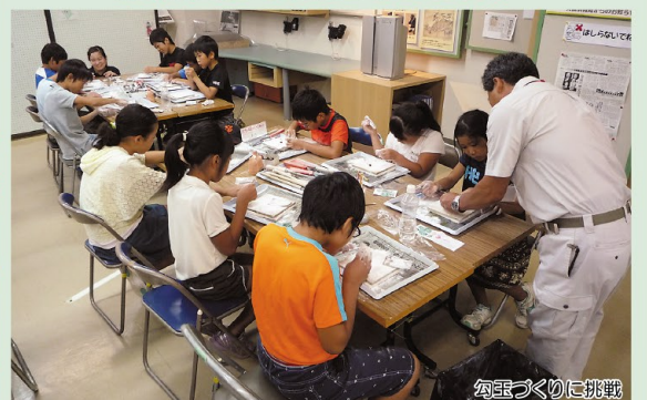
勾玉づくりに挑戦