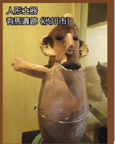
人形土器 有馬遺跡(渋川市)