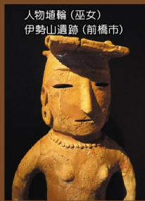
人物埴輪(巫女) 伊勢山遺跡(前橋市)