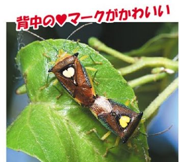
エサキモンキツノカメムシ