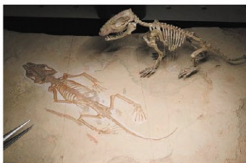
白亜紀の哺乳類ザンゲオテリウム (産状と生体復元/所蔵:田村博)

近年のDNA解析により、私たち人類を含む哺乳類の歴史が詳しく分かってきました。ザンゲオテリウムやアキシマクジラなどの多くの哺乳類の化石標本を展示し、新しい科学的知見から紹介します。