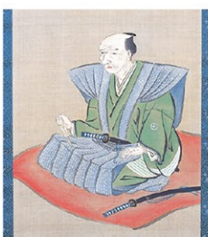
伊能忠敬肖像画(部分) 【伊能忠敬記念館】

上毛かるたでおなじみの関孝和や日本地図を作成した伊能忠敬といった江戸時代の科学者たちにスポットを当て、地図や肖像画などさまざまな資料を通して活気のあるエネルギーに満ちた江戸時代の一端を紹介します。