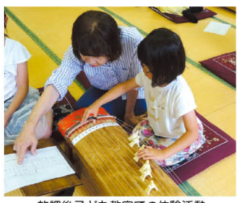
放課後子ども教室での体験活動