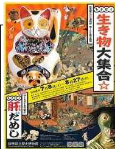
パンフレット表紙