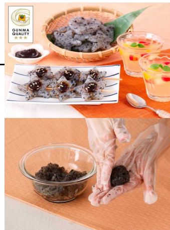
こんにやくを使ったメニュー