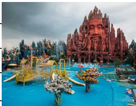
《スイ・ティエン公園／ベトナム》 2009年