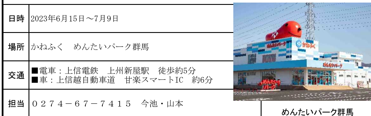
めんたいパーク群馬

これを機に群馬県甘楽町の当工場でその日に製造された『できたて生明太子』を味わっててください。