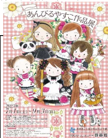
パンフレット表紙