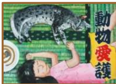
群馬県議会議長賞 小学5年生