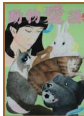
群馬県教育長賞 中学1年生

他の作品は県庁 HP をご覧下さい♪ http://www.pref.gunma.jp/04/p13210165.html