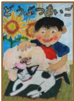
最優秀作品賞 小学2年生

9月20日～26日の動物愛護週間行事の一環として、今年も動物愛護ポスターのコンクールが行われました。県内の小・中学校、特別支援学校に在籍している児童・生徒を対象に、ポスターの創作活動を通じて動物を思いやる気持ちを育ててもらうための事業です。今年は応募総数 11, 714 点の中から 147 点が入選しました。9月24日～10月2日まで、群馬県庁の展望ホールに入選作品が展示され、表彰式も行われました。