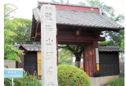
一遍上人ゆかりの寺 聞名寺

板鼻宿イベントWEEKを10月に行う予定です。地元の子どもたちも参加できる紙芝居や歴史家の講演など、地元根差したイベントになる予定です。