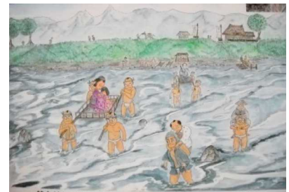
図2 輦台渡しと徒歩渡し 画：小林絵里子氏

今回はその中でも街道に注目し、ガイドコースの1つである「中山道板鼻宿コース」をさらに観光地化するため、板鼻宿マップと案内板の設置を行いました。