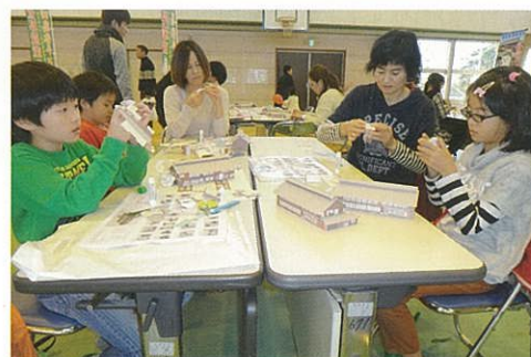
親子でペーパークラフトづくり

「親子で楽しむまち歩きとペーパークラフトづくり」も今回で5回目となりました。旧伊勢崎駅舎、旧時報鐘楼、いせさき明治館、境赤レンガ倉庫、そして田島弥平旧宅と対象を替え、今年も第6弾として「旧群馬県蚕業取締所境支所」を計画中です。当活動は解体が決まった旧伊勢崎駅舎の記憶をなんとか市民の心に刻むための模索から発案されたものでしたが、次第にその視点は明確になっていきました。「建築」という職能と地域を結ぶ活動に継続的に取り組む、次の世代を担う子ども達にこのまちの歴史や魅力を伝え「ふるさと伊勢崎」という種を植える、理論ではなく体験を通して具現化する、等です。