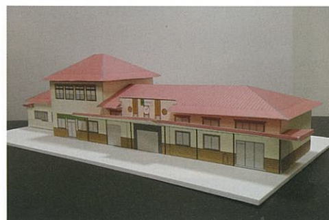
旧伊勢崎駅舎ペーパークラフト

平成15年の発足以来、大谷石蔵の悉皆調査や散策マップの作成、まち歩きの案内人、まちづくりトークセッションの開催等を行ってきましたが、貴重な古い建物は姿を消していきました。貴重と思われる古い建物や道の形態は、このまちのDNAとして無くしてはいけないものであるという市民意識の醸成を模索する中、活動の目線が子ども達へ向けられるようになりました。我がまちを築いた先人の営みを知り、地域の歴史と関わる建物のクラフトを親子で楽しく頑張って作り上げたという喜びの記憶が、いつしかふるさと伊勢崎への愛着と誇りの種となっている、そんな心の醸成にささやかでも貢献できる喜びを、子ども達の笑顔と一生懸命な姿から実感できることがメンバーの活動への内発力の原点となっていると思われます。言葉を替えると、自分たちの時間を人のために使う喜びです。いつの間にか発足から13年経ち、近年県や国からまちづくり功労者表彰を頂いたことも活動のインセンティブとして、今年もひとつ来年もひとつと地道な活動に取り組んでいきたいと考えています。