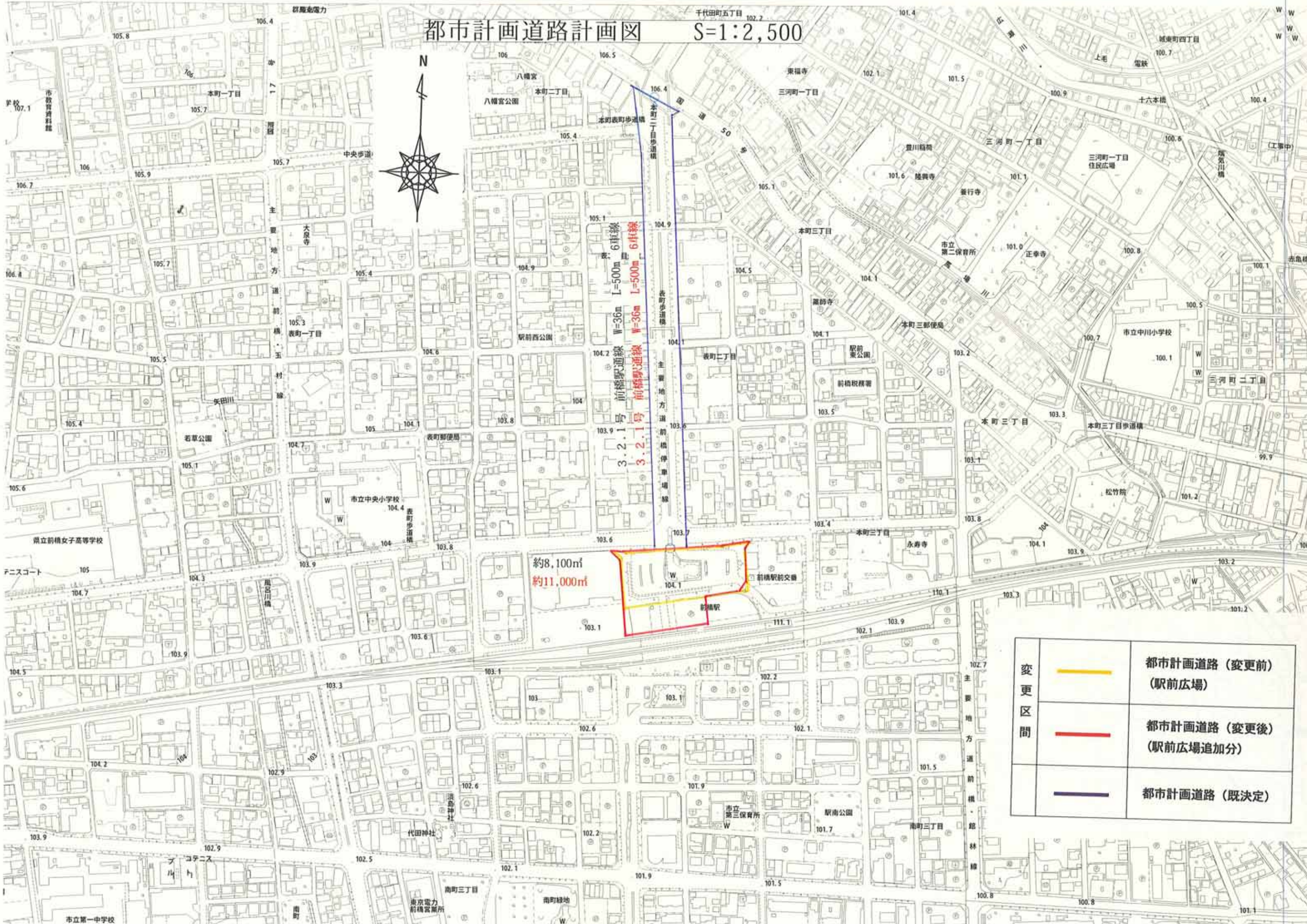
表 6車線 L=500m W=36m 3.2.1号 前橋駅通線 3.2.1号 前橋駅通線 L=500m W=36m