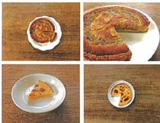
*東京都檜原村の特産物を活用したタルト ルパーブ/ゆずクリーム (開発中)