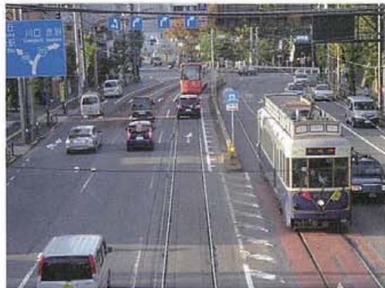
王子は都電が走っています。新しい形式の都電は、懐かしさと新しさの両方を感じることができる大切な観光資源でもあります。

そして現在は、観光分野においては、「住民参加」からその先の「市民協働」へと向かってきています。観光まちづくりの最前線は、「市民協働」を通じて地区単位で観光資源を管理・活用し観光・集客の商品づくりにつなげていく時代に向かっているのではないのでしょうか。観光を通じて地区に収益をもたらす新しい商品づくりへの取組みこそが、観光エリアマネジメントに求められる関係者の姿勢であり、「市民協働」から「住民自治」へとつながる一歩先の地域のあり方を示しているのです。観光まちづくりに関わる主体がそれぞれの想いの花を咲かせる令和の時代の幕開けです。