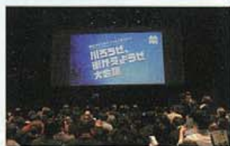
多くの人で賑わう会場

「川ろうぜ、街がえようぜ大賞」を受賞した11団体の方から取組事例の紹介がありましたが、どれも常識に捕らわれない取組で、まちを変えていくためには柔軟な発想が大切なんだと改めて感じました。オープニングから演出が派手だったり、在フィンランド日本国大使館の職員とテレビ電話による中継をして現地の先進事例を紹介したりと驚くことばかりでした。また、スマートフォンを使いリアルタイムで質問やコメントをすることができ、それに対してパネリストがコメントをするなど、会場が一体となったフォーラムになっていて、終始楽しみながらまちづくりについて考えることができました。