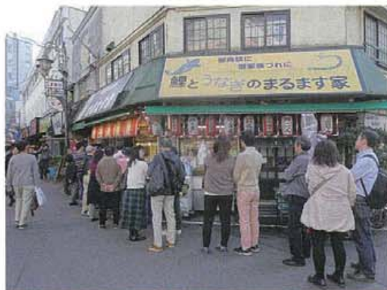
赤羽の人気店では昼でも長蛇の列が・・・、これだけ並ばれていると、つい並んでみたくなるものです。

地域の中には少なからずライバル意識はあります。それを巧く引き出すことで、新たな観光資源の掘り起こしや磨きかけにつなげ、その取組みを通じて地域に対する愛着と誇りを高めようとする「観光エリアマネジメント」の考え方は、先進的な取り組みであり、今後、多くの地域の手本となるのではないかと考えています。