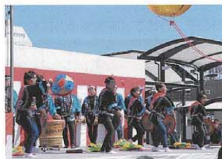
地元保存会による八木節の演奏

完成した西口駅前広場は面積が約7,000㎡(同駅東口広場の1.75倍)であり、東西駅前広場連絡通路から各乗降場へと続く連続シェルターにより、雨に濡れずに路線バスやタクシーへの乗り換えができます。また、多目的トイレと有料駐車場(32台)をロータリーの内側部分に配置し、緑地帯には市内の各団体から寄贈された記念樹や温度計のほか、館林市を象徴する数種類のツツジを植栽しました。開放感のある広いオープンスペースも確保し、民間活力を利用したイベントも企画されています。冒頭で紹介したオープニングセレモニーもこちらで行われました。