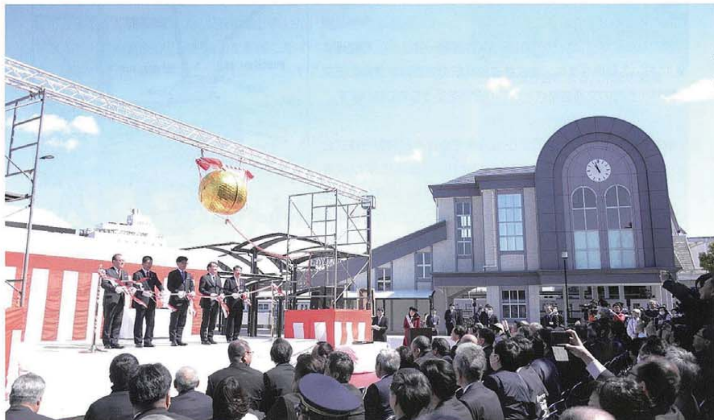
「館林駅西口駅前広場」完成記念オープニングセレモニー

2019. 5. 1 (隔月1回1日発行) 編集発行：群馬県県土整備部都市計画課まちづくり室(企画推進係)