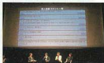
全員参加のバックキャスト討論会