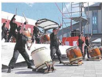
市内の高校和太鼓部による演奏