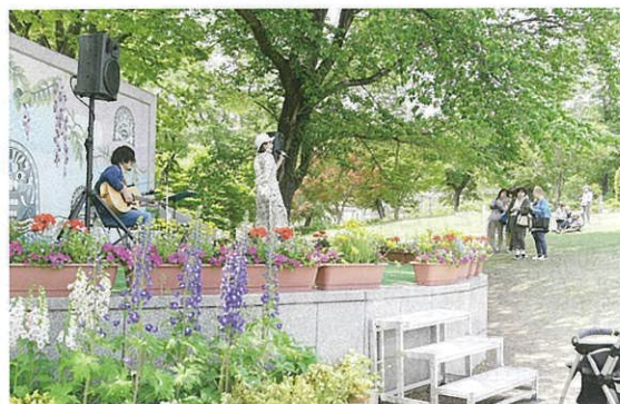
花と緑あふれるステージイベント