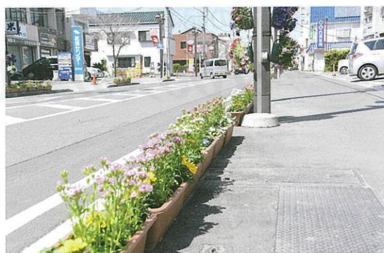
沿道を彩る花飾り

○藤岡市都市施設課 https://www.city.fujioka.gunma.jp/hanamidori/index.html