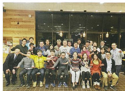
リノベーションまちづくりの仲間たち