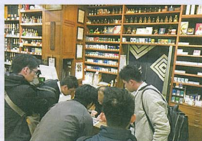
鶴川駅周辺をリサーチしました