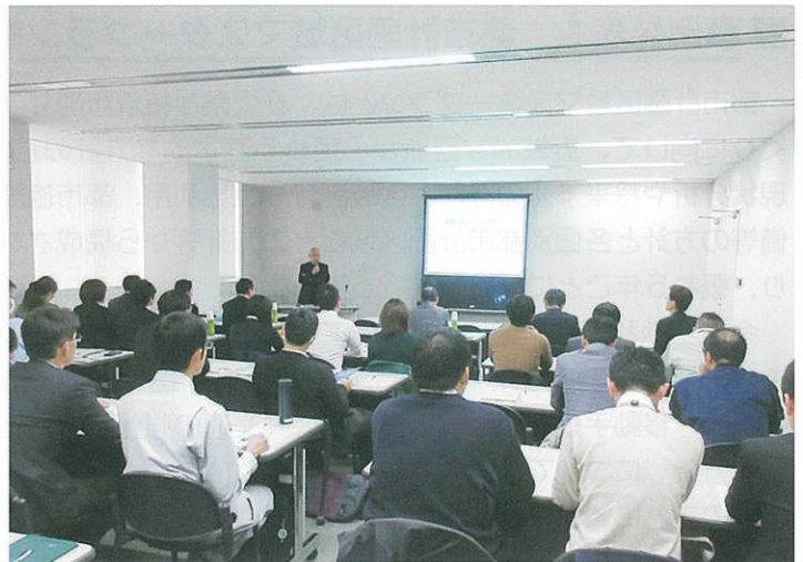
景観講演会の様子