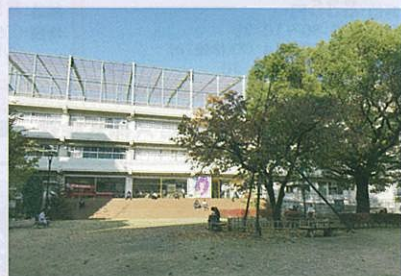
廃校を活用したアーツ千代田3331

この研修には、全国各地から官民連携まちづくりに関わっている研修生が集まります。研修を通して様々な情報交換ができるので、とても貴重な経験となりました。もし、興味がある方がいましたら、ぜひ参加していただきたいなと思います。