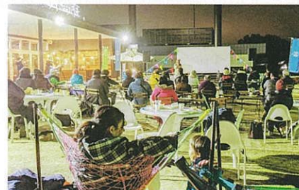
SORANOMONシアターの公開上映

え、もう終わり? あ〜あ。館林市の「おもしろい」をもっとお伝えしたかったのに紙面が足りません。もっともっと知りたくなったあなたは、きっと「おもしろい人」です。さあ、一緒に仲間になっておもしろいことしませんか? 館林で、おまっちゃん〜していま〜す!!