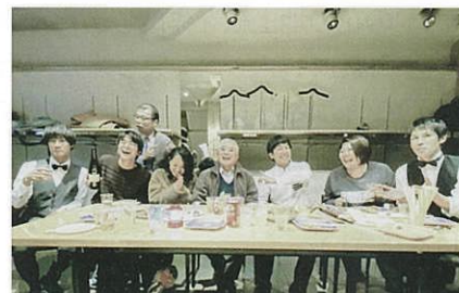
最初の晩餐(中央は不動産のオーナー)