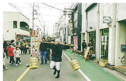
おもしろい人が集結するまちに