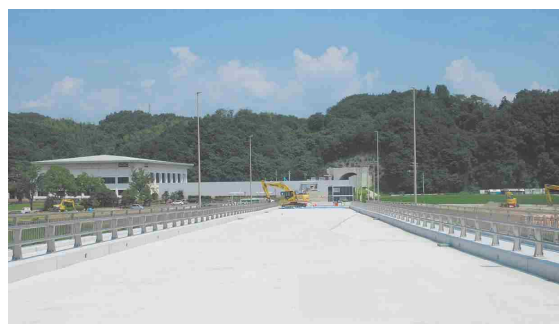
丘陵のスカイライン