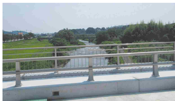
橋梁からの眺望(九十九川の桜並木)

屋外広告物は原則設置不可ですが、特例基準に則った自家広告物や非自家広告物のうち案内誘導広告物の表示は可能となります。自家広告物については、屋上広告物の設置を制限し、他の広告物も高さや表示面積を抑制することで、風景との調和を図り、秩序ある街並みを演出します。また同時に、色数や電光掲示板の設置を制限することで、色彩から受ける視覚情報の煩雑さを防止します。