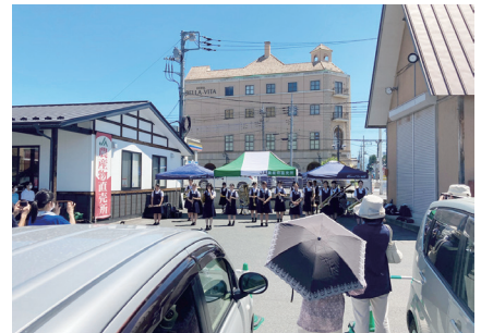
演奏会(沼田女子高校)