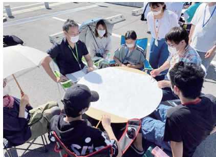
ワークショップ(利根沼田夢大学)