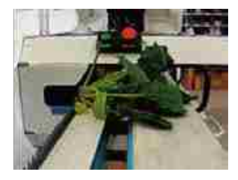
図 3 葉の広がりが大きく調製機への適応性が低い形質のホウレンソウ

(Key Words: Divergence Angle, New Soft-leaf Vegetable Trimming Machine, Spinach)