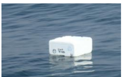
発泡スチロール (トロ箱)