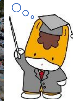
群馬県のマスコット ぐんまちゃん

プラスチックごみは、一度、海に流れ出してしまうと、自然の中ではほとんど分解されず、何百年間も残り続けるとされているよ。