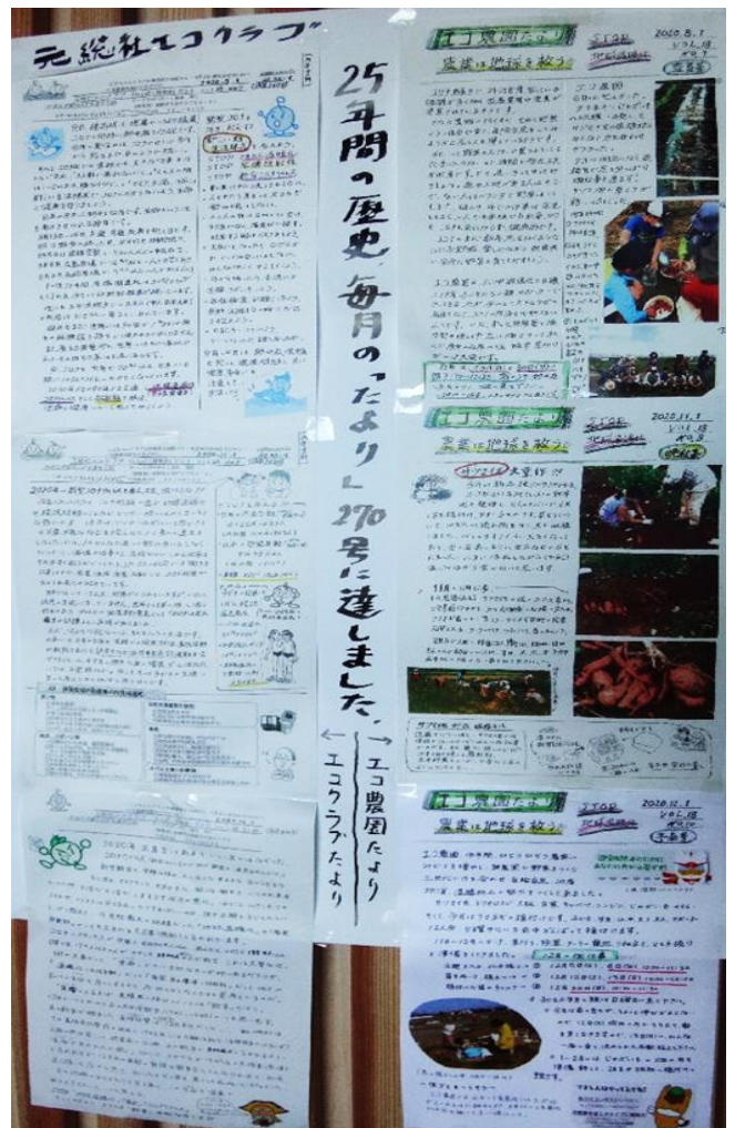
元総社わんぱく冒険隊