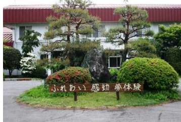
【北毛青少年自然の家の玄関およびキャンプ場】