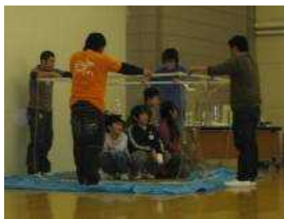
巨大シャボン玉の中に入ったよ