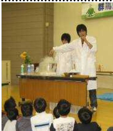
液体窒素を使った低温実験