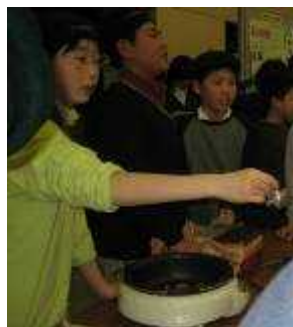
環境冒険隊「どんぐりクッキー」→