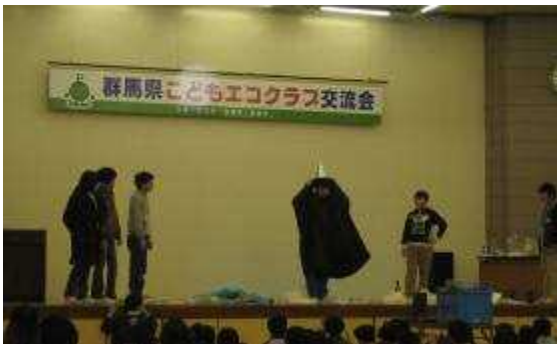
活動発表：南橋中学校演劇部エコクラブ