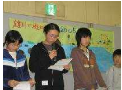
活動発表：ヤマメクラブ