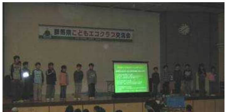
活動発表：前橋市児童文化センター環境冒険隊