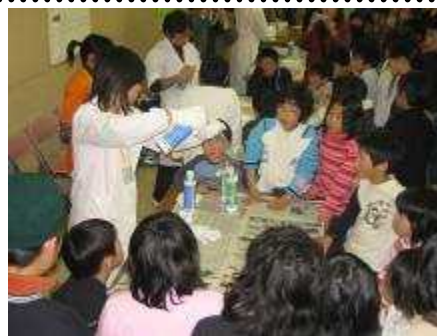
低温実験は、間近でも見られたよ