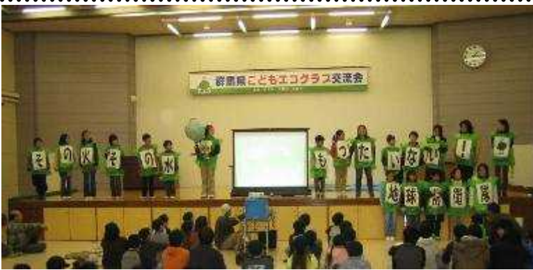
活動発表：高崎北小学校地球防衛隊

平成18年1月28日(土)群馬県青少年会館において「第10回群馬県こどもエコクラブ交流会」が開催されました。今年度は、160人近くのクラブ員やサポーターの方に集まっていただき、各クラブの活動発表や壁新聞、体験ブースなどで日頃の活動の成果を報告しあったり、群馬大学奥沢研究室のみなさんによる科学実験ショーや科学工作で科学の不思議な世界について学んだりと楽しい一日を過ごしました。