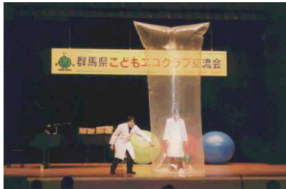
おもしろサイエンスショー