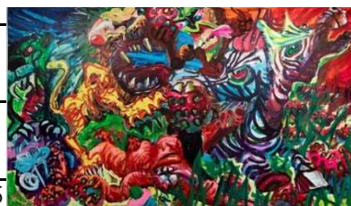
篠原有司男《シマウマとライオンのイチゴ合戦》

1992年 カンヴァスにアクリル絵具 210.0 x 360.0cm ©Ushio + Noriko Shinohara