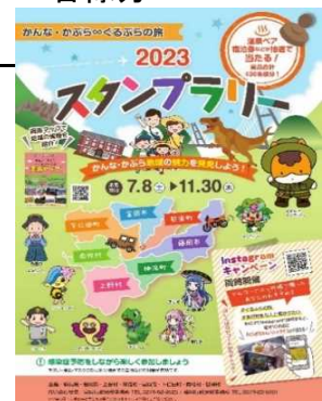
スタンプラリー応募用紙表紙

○URL： https://npogunma.com/g-kabura/2568