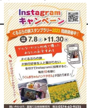
Instagramキャンペーンチラシ