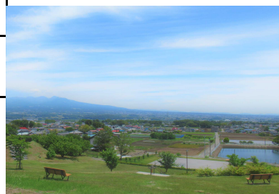
吉岡町城山みはらし公園からの展望

担当 榛東村産業振興課（TEL：0279-54-2211） 吉岡町産業観光課（TEL：0279-54-3111）