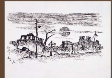
「銀座の落日」 竹久夢二／1923年 関東大震災直後の銀座の 様子をスケッチしたもの