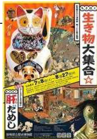
パンフレット表紙