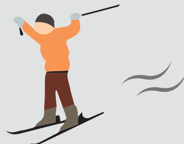
ジュニアスキー教室