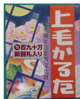
2種類の「ち」の読み札入り 上毛かるた

今回、令和5年12月1日現在の県人口が1,899,297人となり、190万人を下回ったことから改訂を行うものです。