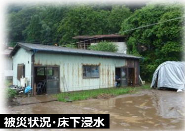
被災状況・床下浸水