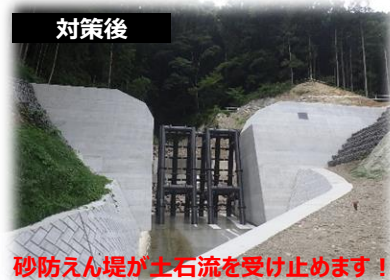
砂防えん堤が土石流を受け止めます！