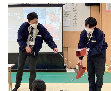
青少年と未来をつなぐ教室

関係諸団体との連携を通して、前橋市内の中学校への出張型キャリア教育の実施、職場体験の受入れなど、未来を担う青少年に学習の場を提供しています。これらの体験を通し、学生の皆さんが鉄や次世代へとつながるものづくりに親しみを持ち、魅力を感じてもらえるよう取り組んでおります。