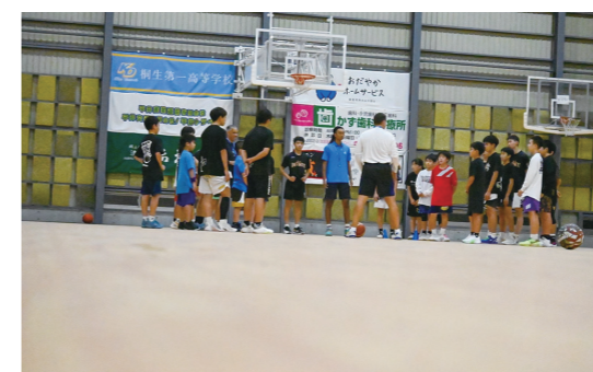
バスケットボールチームを運営

15歳以下のバスケットボールクラブチームを運営しています。子どもたちが夢中になれる場所、夢中をみつけられる場所がNLG INFINITYです。バスケットボールは楽しい、でも楽しめないときもあります。子どもたちには自分で判断し、行動できる選手になってもらいたいと考えています。