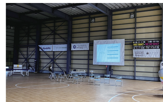
セミナーも開催可能

バスケットボールショップを運営しています。店頭販売はもちろん、チーム対応品メーカーを多数取り扱っています。バスケットボールを知り尽くしたスタッフが丁寧に対応します。