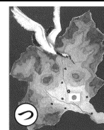
つる舞う形の群馬県/上毛かるた