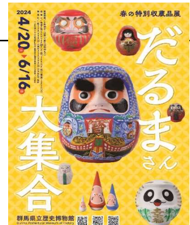
春の特別収蔵品展ポスター