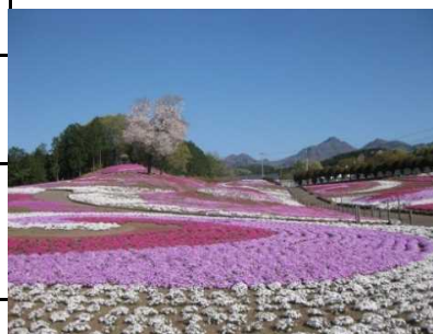
みさと芝桜公園全景