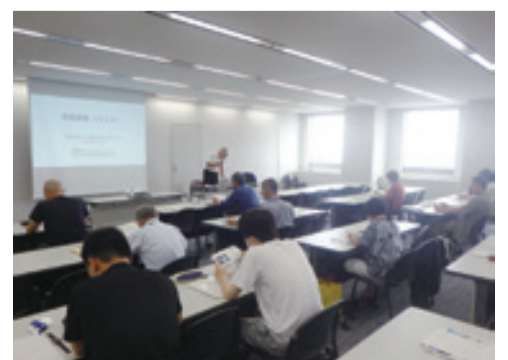
エコカレッジ開催の様子

視覚に障害がある人のために「ぐんま広報」の点字版、テープ版およびCD版(デジター)を発行しています。希望する人は、県庁メディアプロモーション課(☎027-226-2162)までお問い合わせください