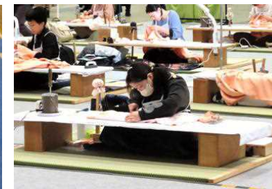
技能五輪全国大会競技風景 (和裁職種)