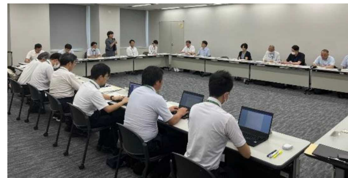
(ぐんま外国人雇用適正化推進PF情報交換会)

外国人労働者が増加し、製造業をはじめ様々な分野で本県経済に欠かせない存在になっている中で、企業における適正雇用や定着を支援するための取組を実施します。