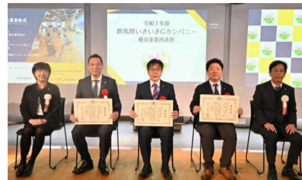
(いきいきGカンパニー表彰式)