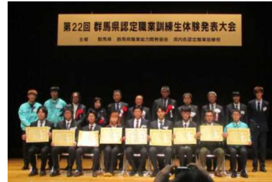
認定職業訓練生体験発表大会