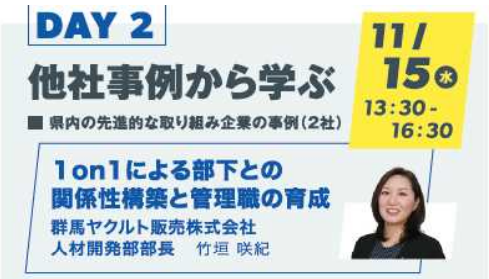
(企業内リーダー研修)