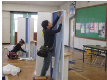
技能検定(内装仕上げ施工)