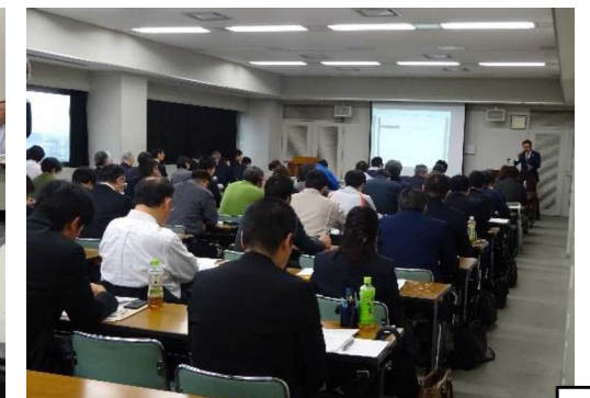
(外国人定着支援セミナー)