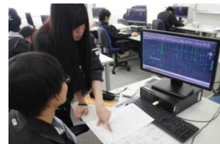
産業技術専門校での職業訓練

主な事業： 産業技術専門校、在職者訓練、離職者等再就職訓練、障害者能力開発、技能振興、認定職業訓練