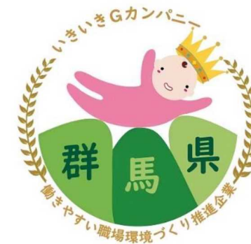
いきいきGカンパニー認証マーク

主な事業： 魅力ある職場づくり事業、群馬県いきいきGカンパニー認証制度、中高年齢者の就労支援、働く女性の活躍推進、外国人労働者の活躍推進、障害者雇用促進