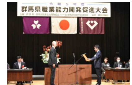
職業能力開発促進大会