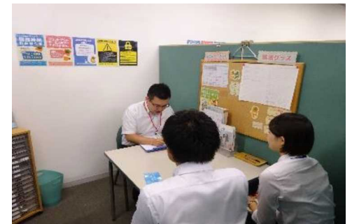
(キャリアカウンセリング)

企業と求職者、求職者同士、企業の若手人材同士の交流等を行い、人材確保や人材定着を支援します。