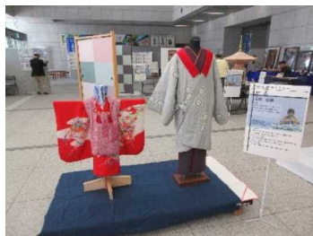
全技連マイスターぐんま会展