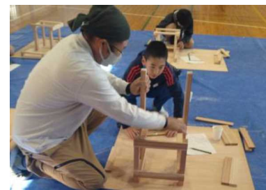
ものづくり体感事業 (建築大工、椅子づくり)