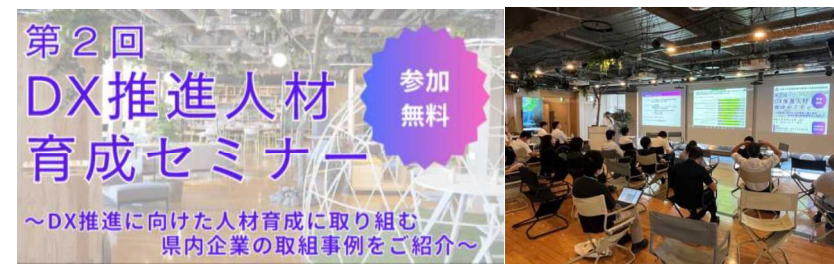
DX推進人材育成セミナー

主な事業： 産業分野における教育イノベーション、ジョブカフェぐんま運営、U・Iターン就職支援、採用力向上、DX人材リスティング推進、DX産業人材育成支援、IT人材育成×女性就労支援「MAITSURUプロジェクト」