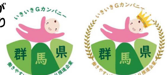
(いきいきGカンパニー認証マーク)