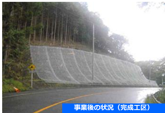
事業後の状況（完成工区）