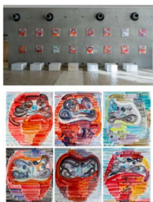
江上 越 (現代美術)