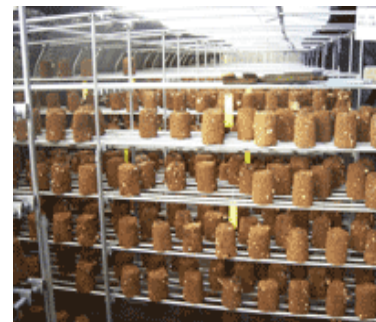
菌床栽培も見学できます。