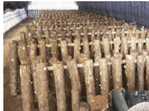
原木栽培されたシイタケ