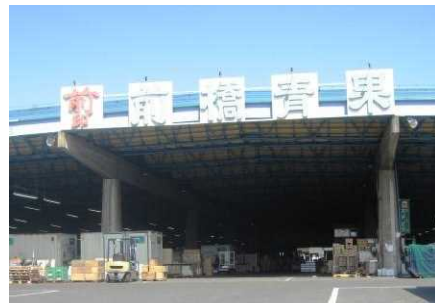
(市場の機構と前橋青果)