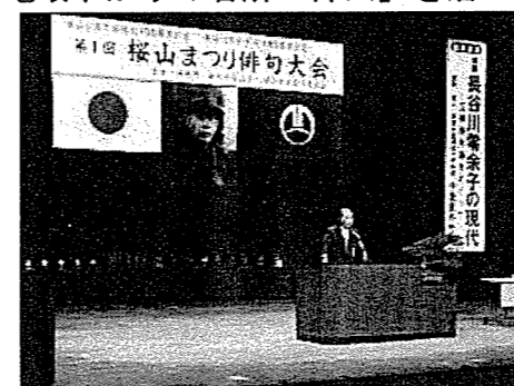
桜山まつり俳句大会実行委員会(藤岡市)

文化資源：桜山、長谷川零余子(俳人) 桜山公園冬桜植栽100周年と零余子没後80周年を記念して俳句大会を開催。