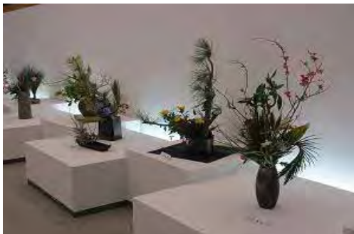
県民芸術祭（華道展（県展））