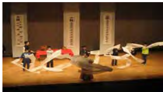
小中学校伝統芸能教室