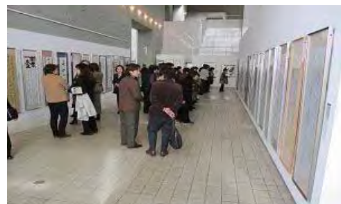
近代美術館ホールでの展示