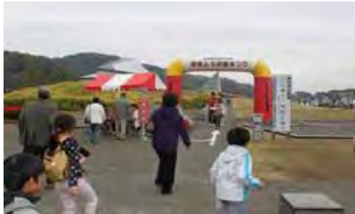
東国文化周知事業（岩宿ムラ収穫まつり）

古代の東国文化の中心地であり、東日本最大の古墳大国である本県が誇る歴史文化遺産について調査研究を進め、再認識を促し、観光やイメージアップ等での活用を図ります。