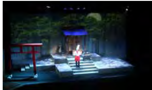
県民芸術祭参加事業