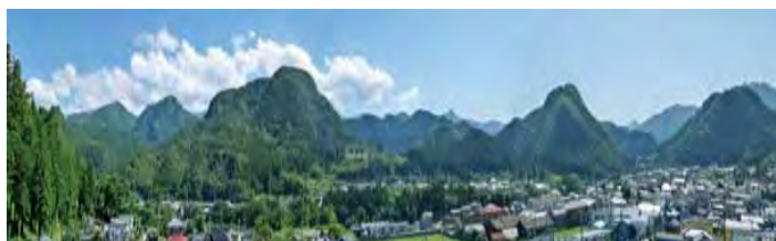
下仁田ジオパーク