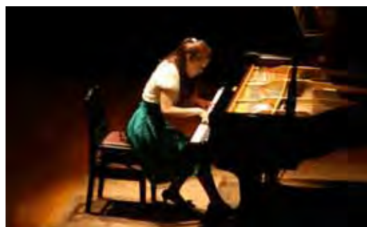
ぐんま新人演奏会（オーディションの様子）