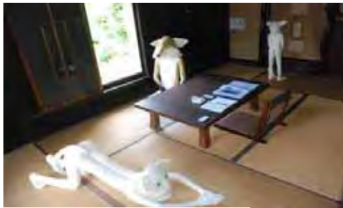
中之条ピエンナーレ展示作品