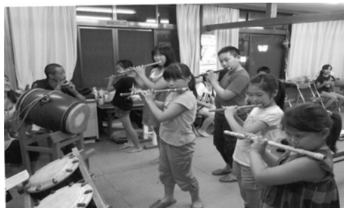
沼田祇園囃子保存会連合会（子どもお囃子教室）