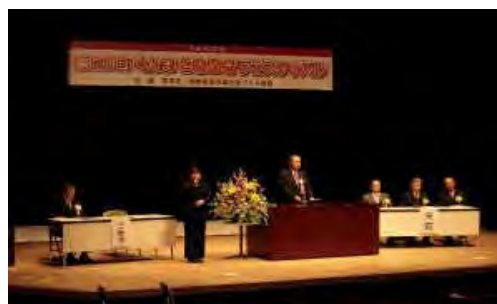
ぐんまときめきフェスティバル(俳句大会)