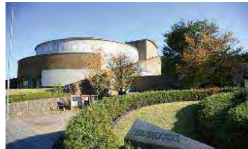
かぶら文化ホール