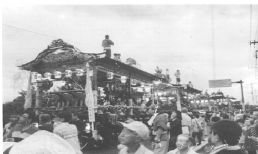
世良田祇園まつり実行委員会（祭りの復活）

小中学生に日本の伝統文化の一つである「邦楽（日本舞踊）」、「人形芝居」の鑑賞や体験の機会を提供し、伝統文化や芸術活動への関心を高め、情操を豊かにします。