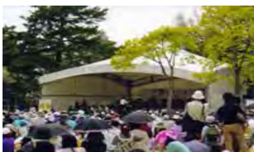
森とオーケストラ（群馬の森公園）