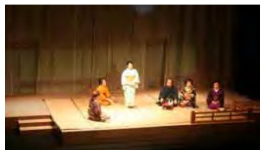
県民芸術祭参加事業