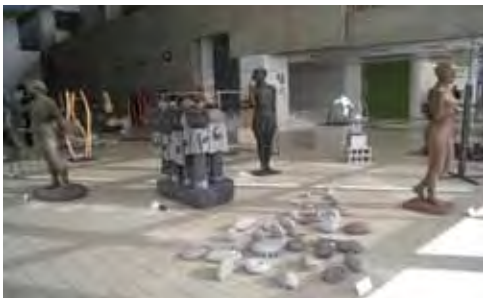
近代美術館ホールでの展示