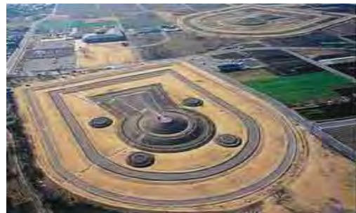
八幡塚古墳・二子山古墳