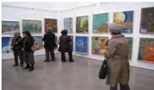
県民芸術祭（美術展（県展））