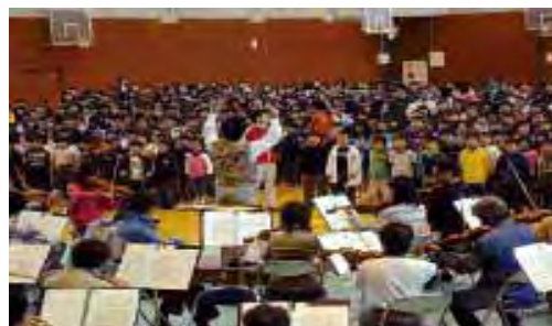
群響移動音楽教室