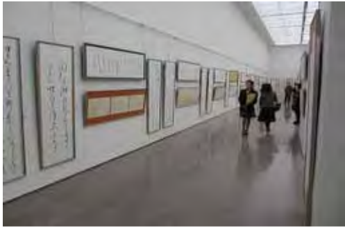
県民芸術祭（書道展（県展））

地域活動するNPO法人と協働して活動する団体が実施する映画祭等運営経費の一部を負担し、地域における映画鑑賞機会の充実等を図ります。