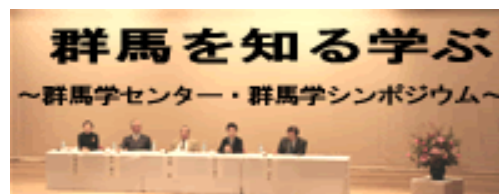
群馬学シンポジウム

群馬の特性、魅力や諸問題を再認識し、新たな地域文化創造や、県民の郷土愛醸成に繋げる「群馬学」推進にあたり、県民や県内外の有識者と幅広く意見交換する群馬学センターを運営します。