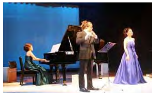
新進演奏家支援事業 「グリーンコンサート」