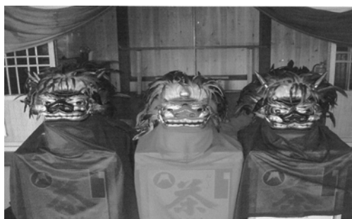
浜川町獅子舞保存会（獅子頭の修繕）