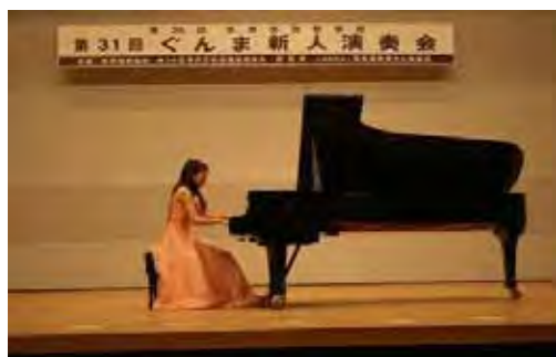
ぐんま新人演奏会