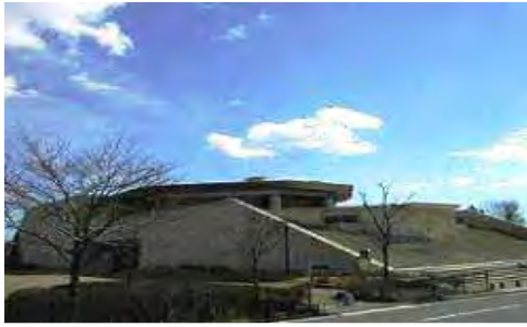
土屋文明記念文学館