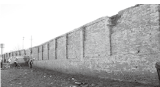
新町戸崎遺跡(旧新町屑糸紡績所)のレンガ護岸